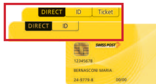
Ihre PostFinance Card oder Ihre PostFinance Card Ticket mit ID- oder TC-Nummer auf der Rückseite